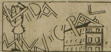
Las casas ultrabaratadas del Grupo «José Solís Ruiz»