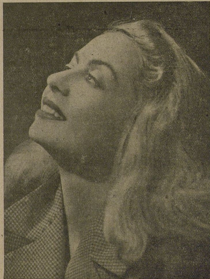
La genial actriz JOSITA HERNÁN, que al frente de su Compañía de Comedias debutará el próximo sábado en nuestro Teatro Principal

de las casas inmediatas y a todas las personas que colaboraron en la eficaz labor de sofocar el incendio y muy especialmente al Teniente de la Guardia Civil y fuerzas de este puesto que tan acertadamente dirigieron los trabajos, evitando con ello una verdadera catástrofe.