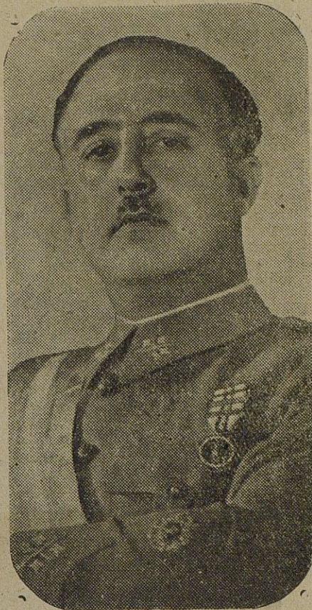
FRANCO, Caudillo de España

Y, hoy, pasados los años, podemos contemplar el acierto de una gestión y el triunfo de la fe. La gue-