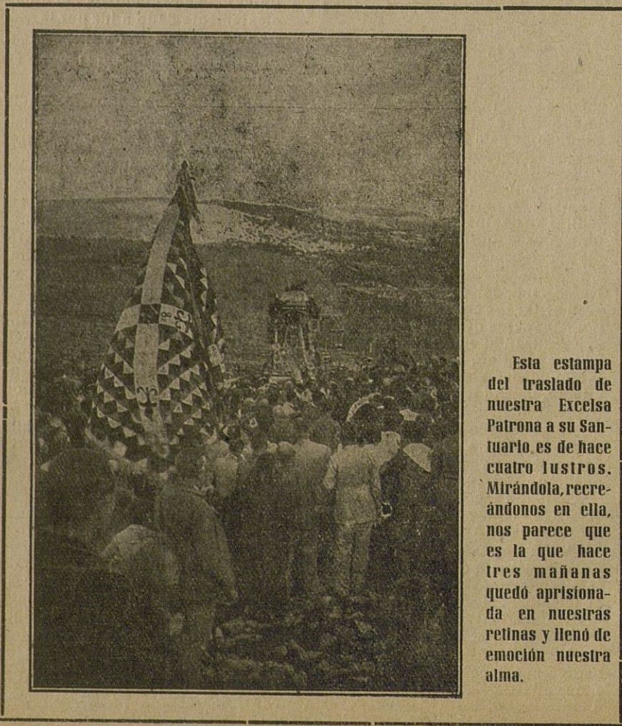
Esta estampa del traslado de nuestra Excelsa Patrona a su Santuario es de hace cuatro lustros. Mirándola, recreándonos en ella, nos parece que es la que hace tres mañanas quedó aprisionada en nuestras retinas y llenó de emoción nuestra alma.

Cabra, 6 de octubre de 1.949.—El Rector, J. Arjona y López.