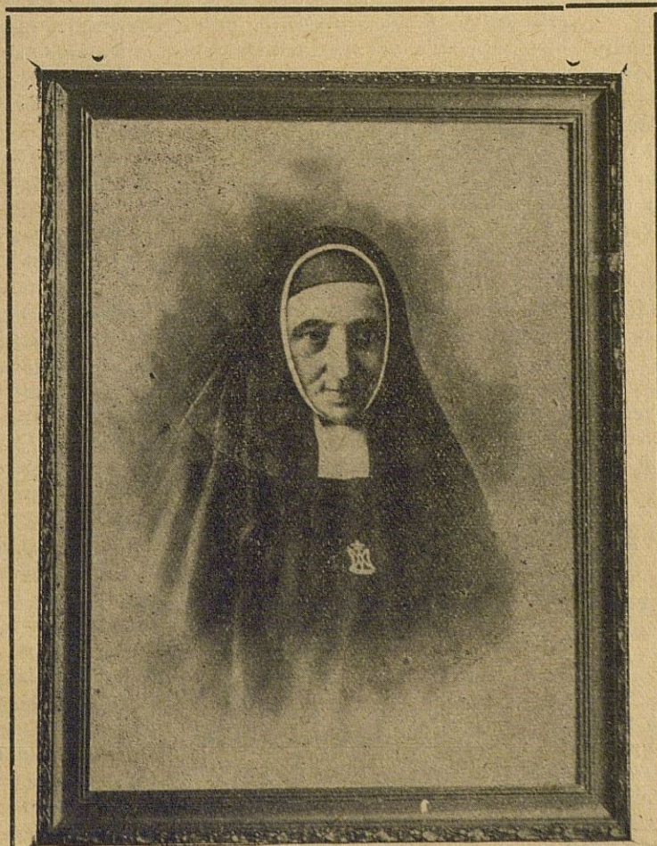
La Rvdma. Madre Paula Montal Insigne Fundadora del Pío Instituto de Religiosas Hijas de María Escolapias

Y la Rvdma. Madre General, Rvda. Madre Primera Asistente de la General, Rvda. Madre Provincial y las antiguas maestras que han estado entre nosotras estos días, con las actuales, han visto cómo las antiguas alumnas y las que hoy,