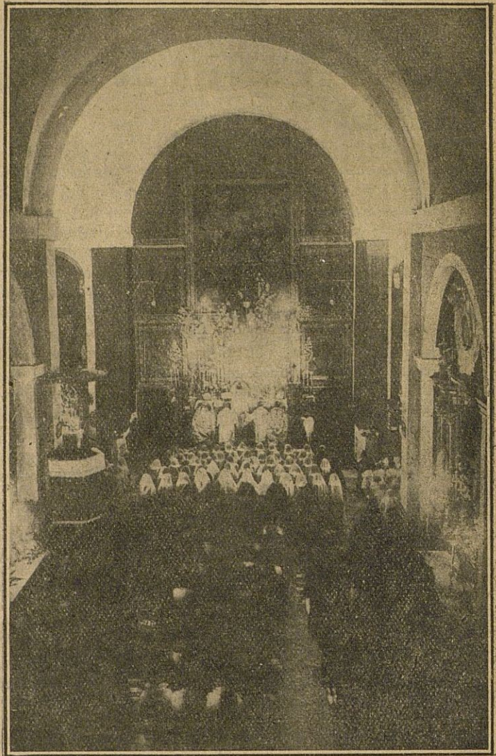
La histórica iglesia donde en tiempos pretéritos resonaban los graves y litúrgicos cánticos de la Comunidad de PP. Capuchinos y en nuestros días tienen lugar las solemnidades religiosas del Colegio de RR. Escolapias.

Así vive Cabra, sin alharacas, ni estridencias consagrada al estudio, por eso es famosa, y por eso es envidiada, por eso todos los años de sus hogares pedagógicos brota una nueva generación, culta, capacitada, instruida y preparada, para la lucha eterna de todos los días y de todos los tiempos: la lucha por la vida.