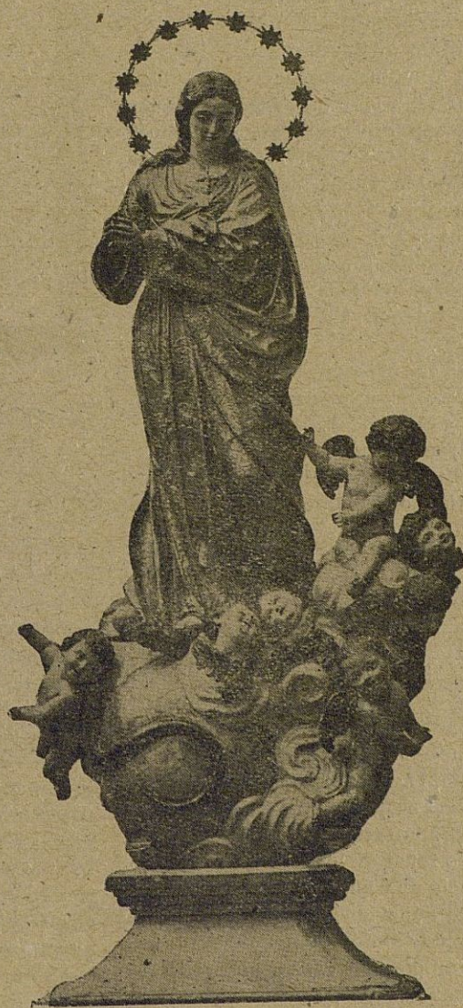
La valiosa escultura de la Purísima, Patrona de nuestro Real Colegio, en cuyo honor se celebrarán mañana, las tradicionales Fiestas Cívico-Religiosas

Es emocionante esta institución. Tiene delicadeza y suavidad, y trascendencia también, porque los niños advierten, en medio de su