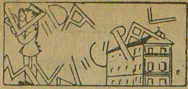
El padrón de perros