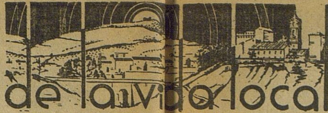
de vida local