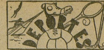
El Atlético Egabrense toma parte en el Campeonato de tercera categoría Regional