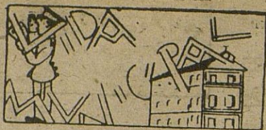
El Padrón de edificios sobre desagüe de canalones etc.

El Alcalde de esta Ciudad. Hace saber: Que confeccionado el Padrón de edificios sujetos al arbitrio establecido sobre Desagüe de Canalones y Bajadas de Agua a la Vía Pública o terrenos del común, correspondiente al ejercicio en curso, queda expuesto al público en la Secretaría de este Ayuntamiento por el plazo de 10 días hábiles a los efectos de las reclamaciones que contra el mismo pudieran formularse por los contribuyentes en el mismo comprendidos.