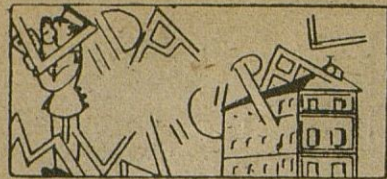
El Ayuntamiento de Cabra y el Santuario de nuestra Patrona