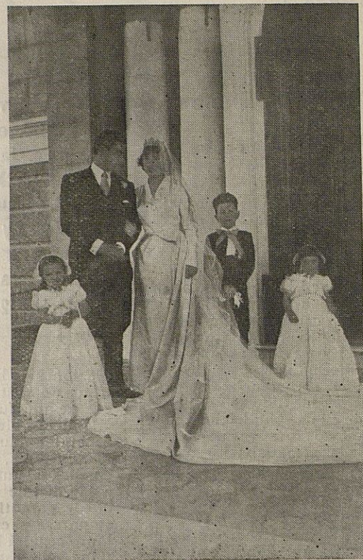
Los novios, con sus sobrinitos, después de la ceremonia

El altar estaba adornado con refinado gusto con claveles blancos, ardiendo infinidad de luces que convertían el templo en un ascua de oro. El cuadro de la Santísima Virgen del Perpetuo Socorro, de la que es muy