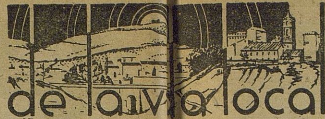
de la vida local

Opuestamente a los que el Padre Peña llamaba «hombres de libras», él nos dió el ejemplo de ser un auténtico hombre de libros. Porque éstos fueron, siempre, para el Padre Peña, el talismán con el que se conquista el corazón del mundo. Porque los buenos libros son el refugio y la esperanza de toda alma que vive pegada del suelo. Porque los buenos libros son el pan de nuestro espíritu, manantial de bellezas y de armonías, eco de nuestro encendido corazón, el amor más desinteresado; el Padre Peña los sembraba a voleo, como buena semilla, los ponía en todas las manos, los cantaba, los prodigaba, regalándolos. Así ejercía el apostolado del verdadero amigo del libro. ¡Cuántas veces entraba en nuestra Biblioteca en busca del buen libro, para ponerlo en alguna mano reacia, suspicaz o escéptica, con la misma diligencia y amor que la mano generosa lleva la medicina a la cabecera del enfermo! ¡No merece el título de apóstol del libro, quien lo busca con amor y lo aplica al alma como un