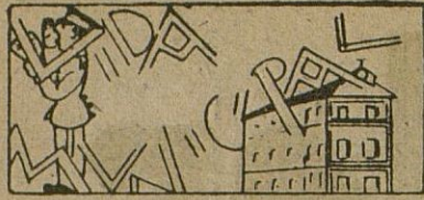
El padrón de vecinos