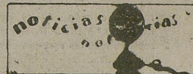
Preliudios de boda

Suplican a sus amistades y personas piadosas una oración por el alma de la finada.