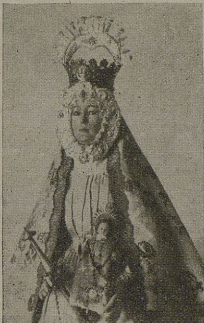
Nuestra Señora del Rosario Patrona de La Esperanza, en cuyo honor se celebrarán el sábado y domingo venideros solemnes fiestas en aquel suburbio egabrense.

Esta excelencia de la imagen sobre la lectura es bien conocida de antiguo y de ahí que cada vez que haya prosperado más la costumbre de que los libros se publiquen con ilustraciones, aunque a veces no sea preciso explicar nada con ellas, sino simplemente animar las páginas. El cine y la televisión viene a poner al alcance de todo el mundo o de casi todo, multitud de imágenes para cuya incompleta descripción serían preciso miles de libros. Pero de eso a resignarnos a admitir que la letra impresa llegará a ser un atraso y pasará a convertirse en una forma arcaica de enterarse de las cosas, no creemos