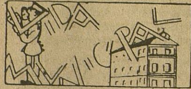
Colocación de preparados de estricnina

También hay clases especiales a precios sin competencia, y VINOS dulces Pedro Ximénez a 5, 6 y 7 pesetas litro y Vinagres puros de uva.