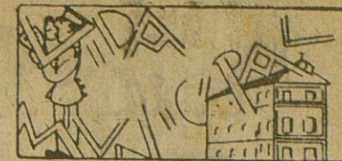
El padrón por el servicio de aguas a domicilio.

Vida Municipal: Un edicto sobre los Presupuestos de 1956 y otro acerca del padrón por el servicio de conducción de aguas.-El movimiento demográfico habido en Cabra durante el último mes del año 1955.-Otras informaciones y noticias o o o o