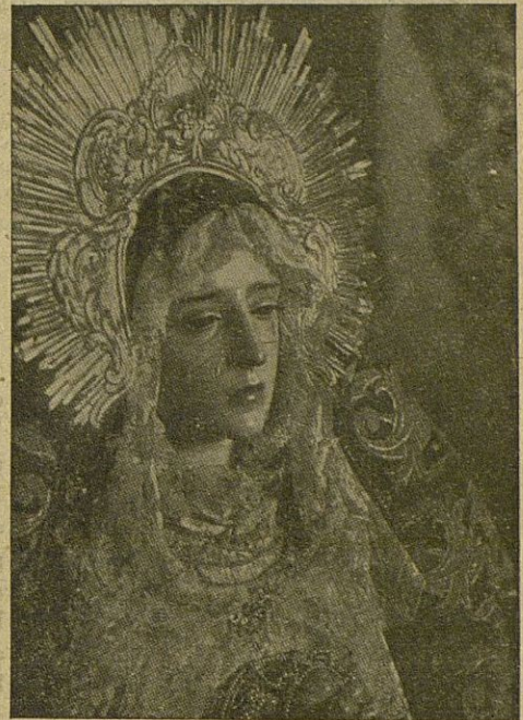
NUESTRA SRA. DE LA SOLEDAD Y QUINTA ANGUSTIA

Esta noche se reanudarán los desfiles, sin interrupción de días, hasta la mañana del Domingo de Pascua