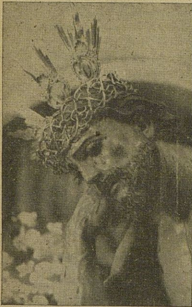
CRISTO DE LOS MOLINEROS...

Dame la espiga dorada que, en estallido de grano, la caricia de tu mano prodiga por la explanada.