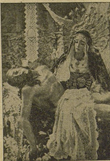
NTRA. SRA. DE LAS ANGUSTIAS (De la procesión del Viernes Santo, noche)