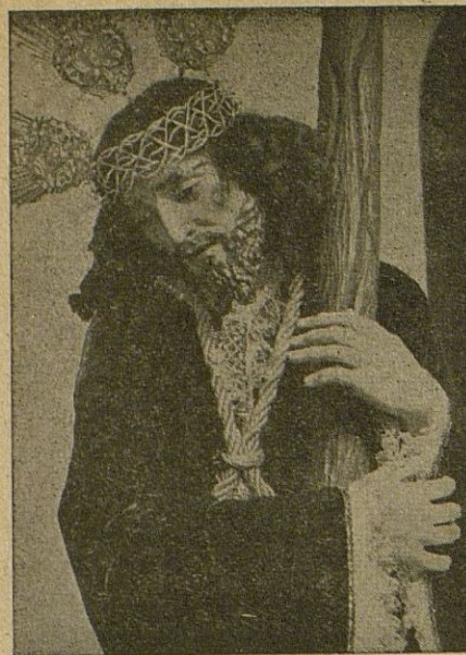
N. P. JESÚS DE LAS NECESIDADES (De la procesión de esta noche)