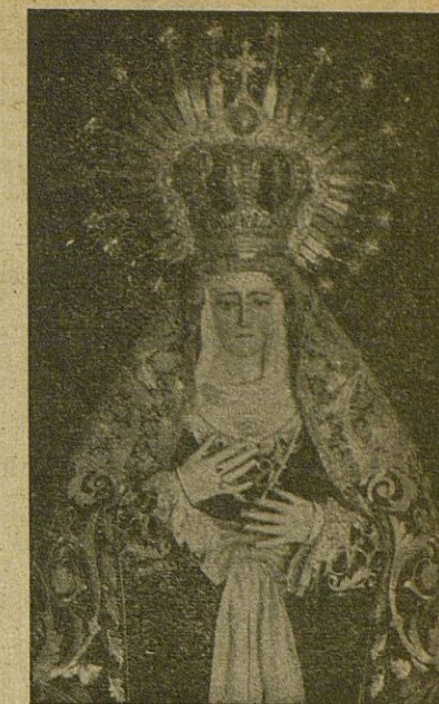
NTRA. SRA. DE LOS DOLORES (De la procesión del Viernes Santo, noche)