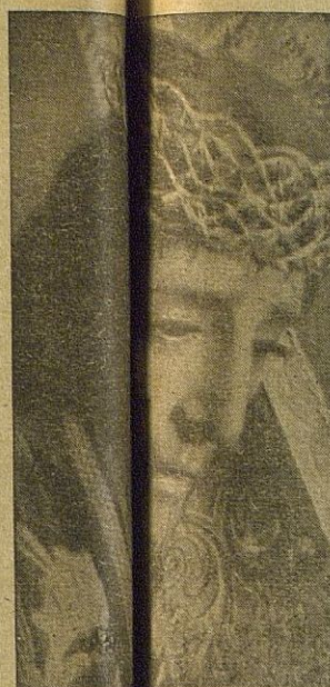
NTRA. SRA. NAZARENO (De la procesión del Viernes Santo, mañana)