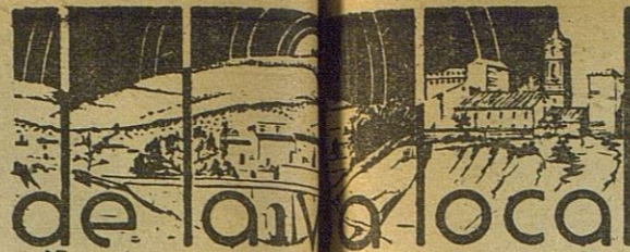
de la zona local