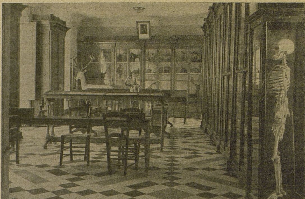
Perspectiva del Museo de Ciencias Naturales