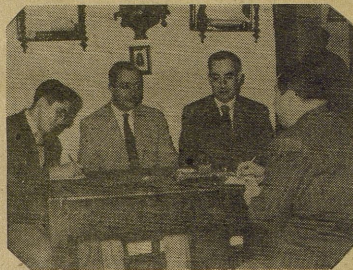
El Corresponsal de la Agencia Cifra y nuestro nuevo Redactor Emehache, entrevistando a los afortunados quinielistas

El primero, por tercera vez, en cantidad importante.