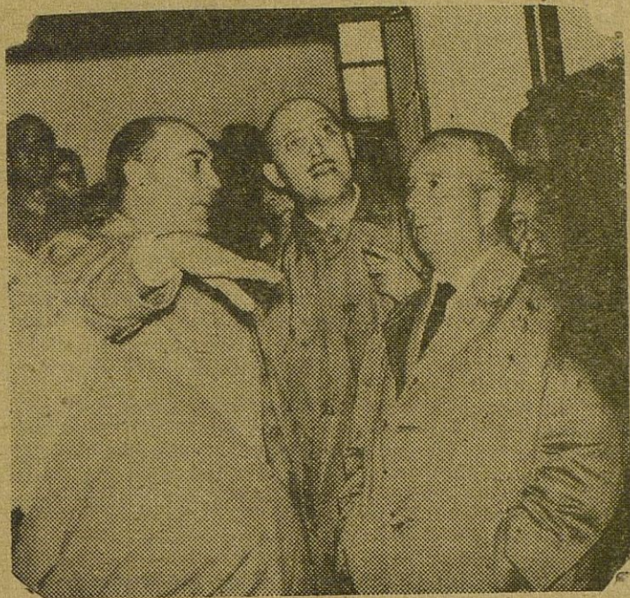
El Ministro y otras Autoridades, en la Cooperativa Olivarrera