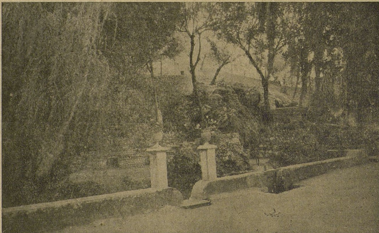
Un aspecto de nuestro Parque Municipal «Fuente del Río»

El día 13 a las 8 y media de la mañana se dirá en la Parroquia de Nuestra Sras. de los Remedios, una misa en sufragio del alma de la finada.