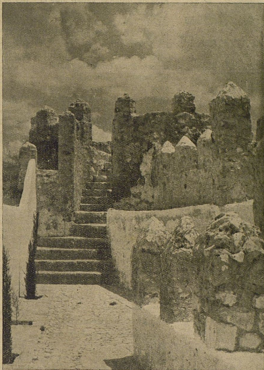
Recinto amurallado de la Villa de Cabra en la época visigoda

Como muy distinto del progreso científico, es el intento de entrapolar su significación, haciendo creer a los ingenuos que ese progreso constituye la panacea universal de la problemática humana. Equivocación funesta, de la que la humanidad deberá estar ya escarmentada. Por más que se pretenda explotar la materia, hay que afirmar bien alto que