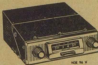
N3E 96 V

Electrodomésticos-Gas Butano - Radio - Amplifica- ción. Frigoríficos y Televi- sores de todas las marcas