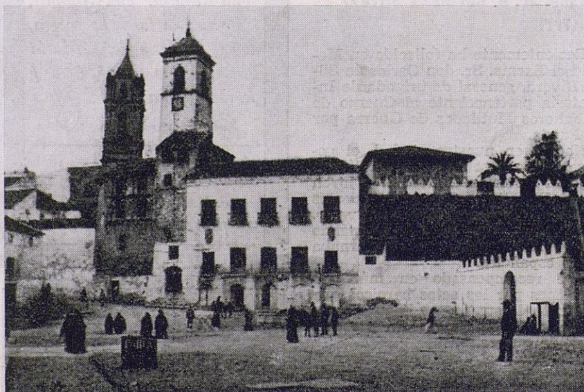
La Plaza Vieja a principios de siglo.