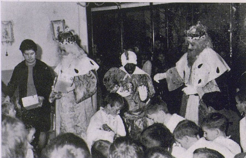
La campaña de «Radio Atalaya» consiguió donativos de todas partes que se transformaron en una lluvia de juguetes que sus Majestades reparten en la Guardería Infantil «San Rodrigo».

Y esta música de la que vamos a ocuparnos es otra. Vamos, otro cantar. Según nos informa persona que nos merece entero crédito, el concurso de escaparates anunciado con motivo de las fiestas de Navidad y organizado por la Comisión de Fiesta, ha sido declarado desierto por considerar el jurado, cuya composición desconocemos, que ninguno de los que concurrían, tenía méritos suficientes. Señores, esto es inaudito. No estimamos tener mejor gusto artístico ni mayores conocimientos que los señores a quien tal misión les fue encomendada, pero ¿es que a la hora de tomar una resolución de esta índole, no hay que tener en cuenta el esfuerzo económico de los dueños de los establecimientos ni la enorme voluntad de