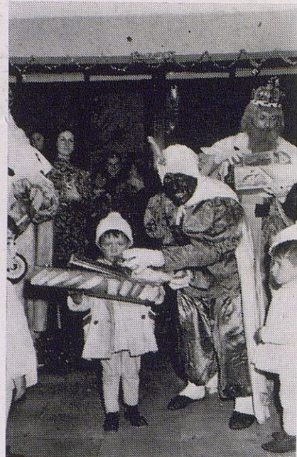
Un momento del reparto

El Centro Filarmónico Egabrense celebró su tradicional Festival de Música y Teatro y, como siempre, amparado en éxito total y defini-