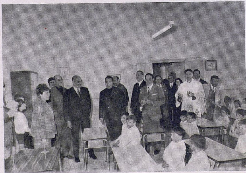
El Ministro Sr. Solís inaugura la Guardería Infantil