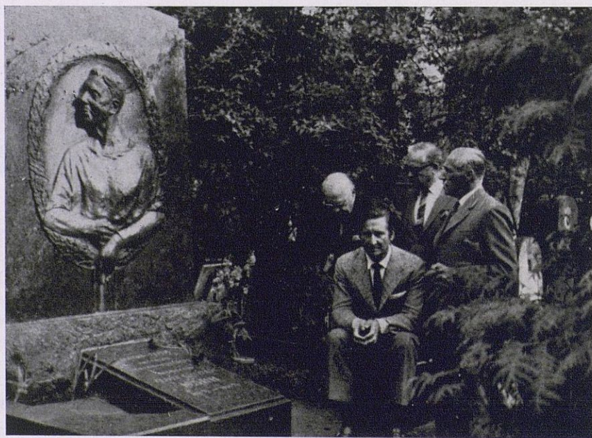
Los cuatro médicos españoles ante el mausoleo del gran cirujano, primero que congeló la sangre.