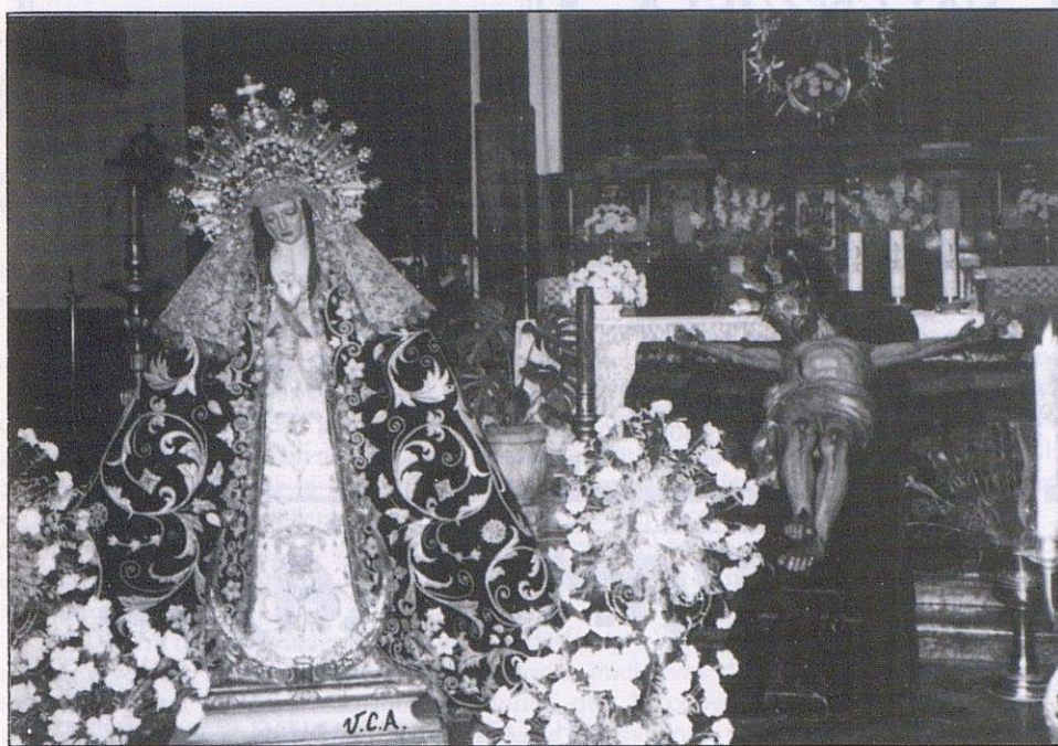
Pasan los siglos. El Cristo de la Sangre, la Virgen del Socorro, compartiendo su capilla, compartiendo el Altar de la Parroquia de la Asunción. Domingo de Ramos, 1992.

Llegó el Viernes Santo. Mayor Dolor, Nazareno, Rocío. A pocos minutos de las doce hacen su encuentro el Nazareno y la Virgen del Rocío en sus Misterios Dolorosos en la Plaza Vieja. La Virgen del Mayor Dolor, esperaba a su lado, callada, pausada, con respeto, como olvidada.