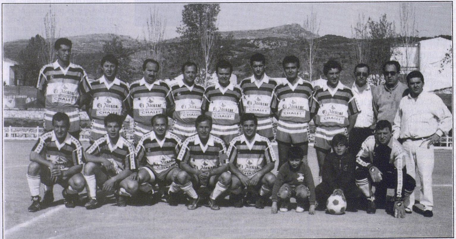
U.D. Guadalquivir: Campeón Liga 91/92 y Subcampeón de Copa 1992