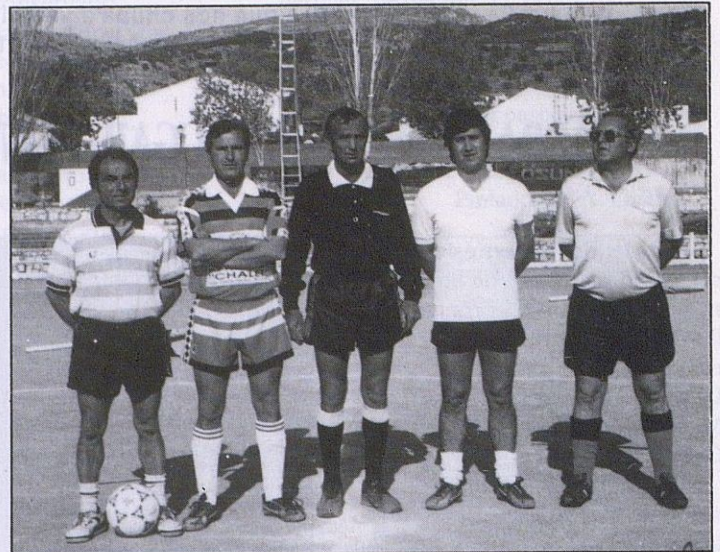
El trío arbitral con los capitanes de ambos equipos.

BRENSE fue un derroche de fuerza y garra que propició que 4 jugadores se plantaran solos ante el meta Manolo, Vicen Palomar clavó el tanto y sentenciaba un partido en que había predominado la igualdad y la corrección. Faltando muy poco para la conclusión del encuentro la defensa de la A.D. EGABRENSE provoca "manos" en el área, que el árbitro sin dudar lo señaló como penalty.