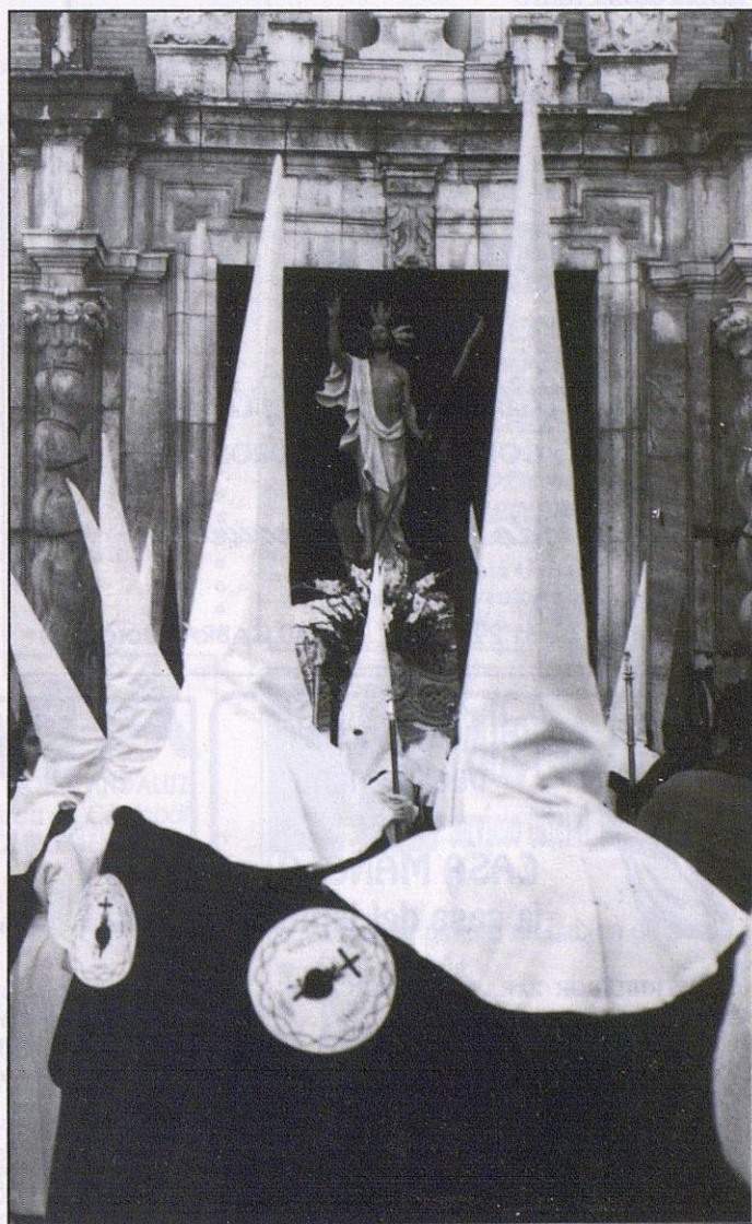
El Resucitado. Año 1990.