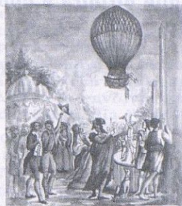
aerograma - air letter