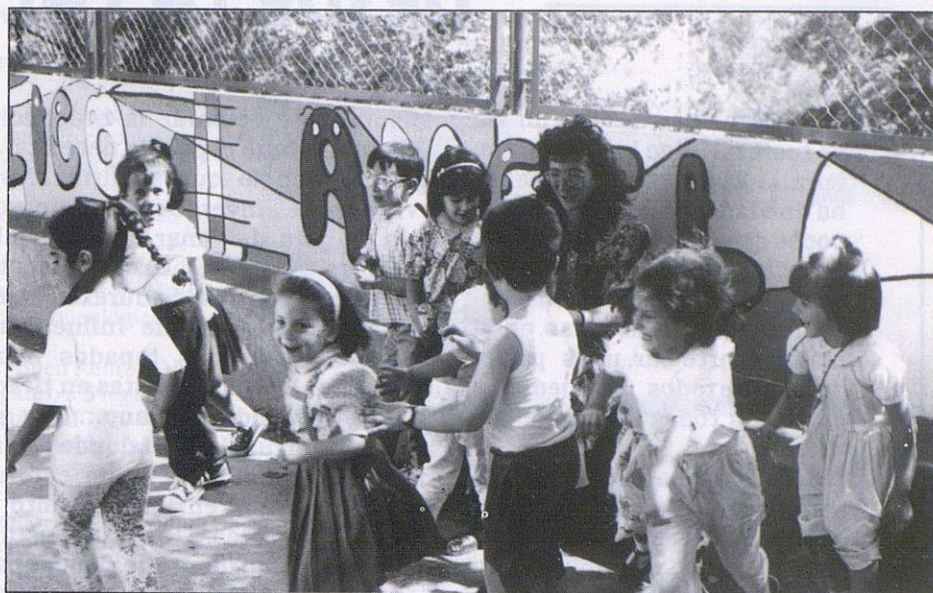
COMIENZAN LAS VACACIONES VERANIEGAS ¡A pasarlo bien!