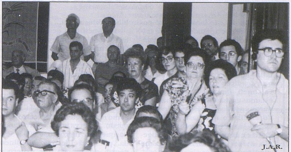
Salón de Plenos el día de la constitución de la nueva Corporación. Pocas veces se ve así de concurrido.

El lugar de celebración será la Casa de la Cultura de Cabra.