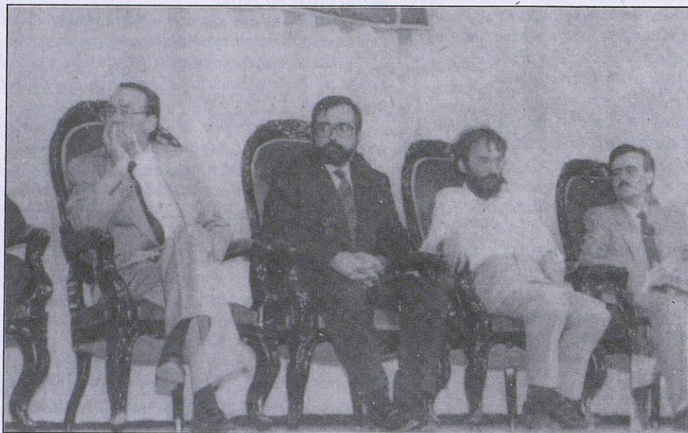
Un momento de la clausura de las Jornadas en el Cinestudio Municipal

Las Jornadas Internacionales sobre Alcalá Galiano, que ya comentábamos en el pasado número concluyeron el sábado 19 de Septiembre con el acto de hermanamiento de la isla canadiense Galiano y la ciudad de Cabra