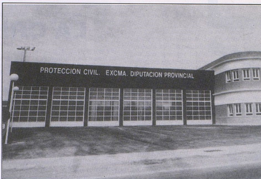
¿Para cuándo la apertura del Parque Comarcal de Bomberos de Lucena-Cabra?

boración de las Delegaciones de Cultura, Educación y Juventud del Ilmo. Ayuntamiento de Cabra y de la Caja Provincial de Ahorros de Córdoba