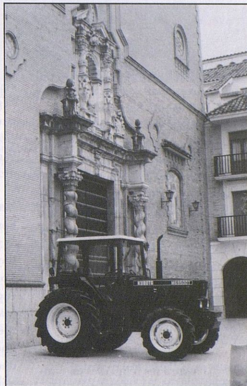
Texto y Fotografía: Antonio Córdoba

Una vez más, el despliegue de la feligresía de Santo Domingo ha llegado a todos los rincones. Una vez más, el popularmente conocido como "Llanete" se convirtió en una muestra de generosidad. Allí estaba EL TRACTOR CONTRA LA POBREZA.