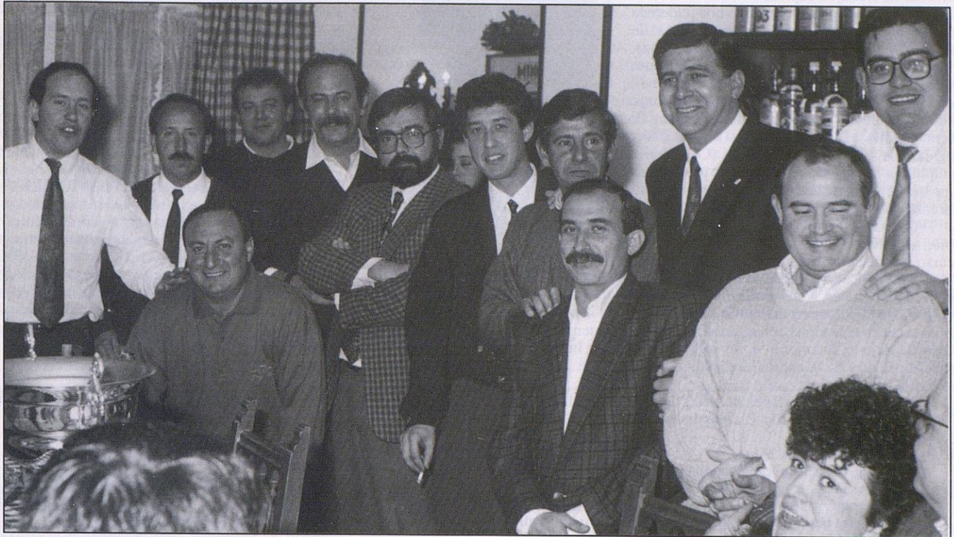
Cena de Fin de Temporada del Club

Su objetivo: promocionar un deporte con escasas condiciones naturales en Cabra