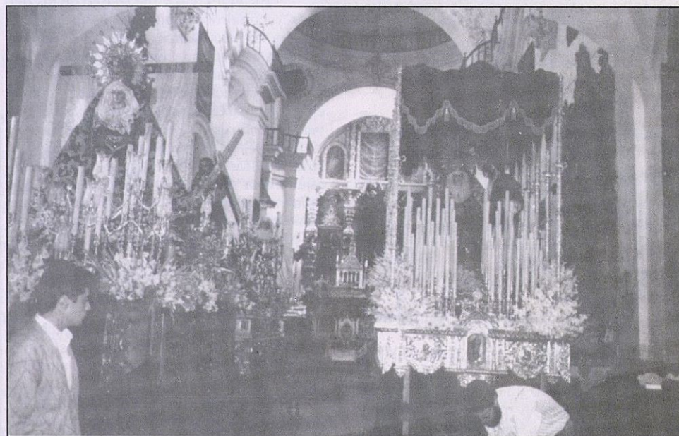
La Semana Santa es el tiempo más oportuno para que las Cofradías que procesionan desde la Iglesia de San Juan de Dios, tomen conciencia de lo que supone la urgente restauración de la misma.