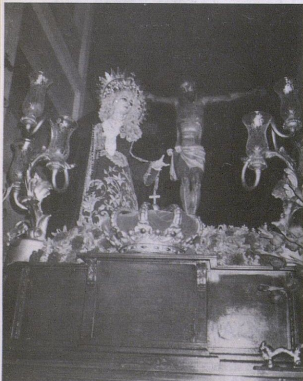
Primer Paso de la Real Cofradía del Lunes Santo. Cristo del Calvario junto a la Imagen de María Stma. de la Concepción. V. Córdoba

Por otra parte, la Cofradía del Stmo. Cristo del Calvario, ha procesionado la Imagen de María Santísima de la Concepción, a los pies del Sagrado Titular.