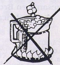
NO Leche a granel