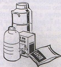
SI Leche envasada

El Distrito Sanitario de Cabra inicia con este artículo una campaña informativa sobre Alimentación, denominada "Protagonista de tu salud", y dirigida a los ciudadanos de los municipios que integran este Distrito. Está orientada a fomentar conductas saludables, al alcance de la población en general.