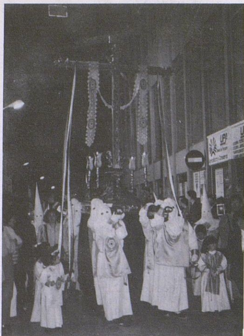
La Cruz de los Novios, en la Calle Cervantes. Vicente Córdoba

Un numeroso público se agolpaba a la puerta de la Parroquia de la Asunción y Angeles, para ver la salida de Ntro. Padre Jesús Preso, que después de muchísimos años vuelve a recuperar su salida, de donde tiene su Capilla, aunque con las últimas luces del día. Curiosa estampa, con algunas "recuperaciones" en sus Andas.