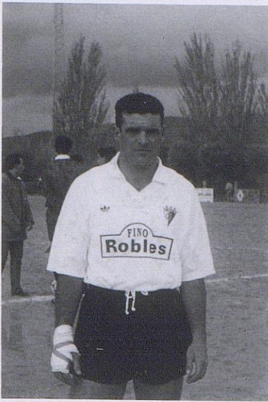
Moreno, una gran batuta en la línea medular.

ocupada (1,8 goles por partido). En la última jornada venció con muchísimo apuro a uno de los equipos descendidos de su grupo.