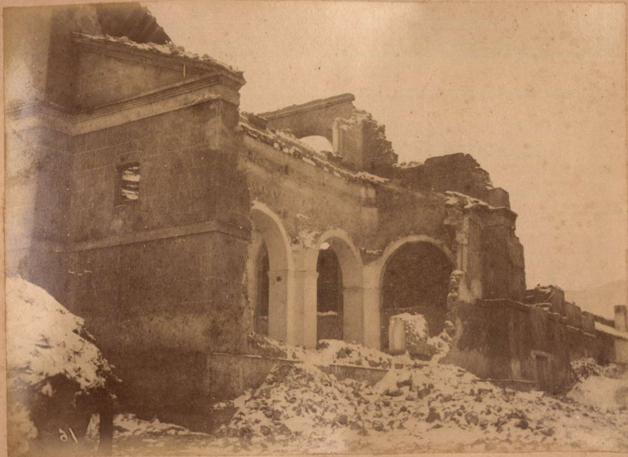
IGLESIA DE CHOZAS DEL REY. (ZAFARRAYA).

Terremotos del Sud de España en 1884 y 1885.