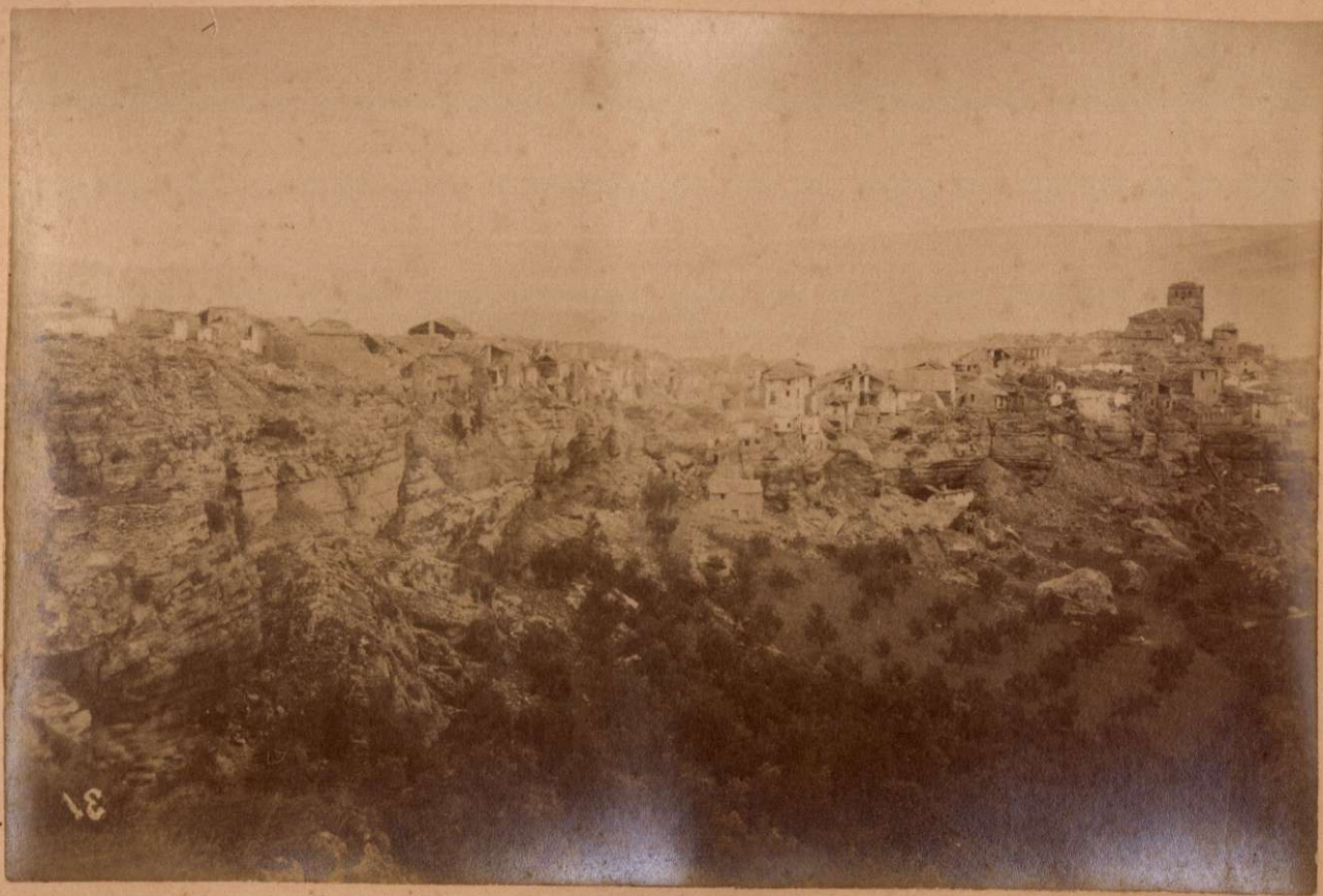
EL TAJO DE ALHAMA.

Terremotos del Sud de España en 1884 y 1885.