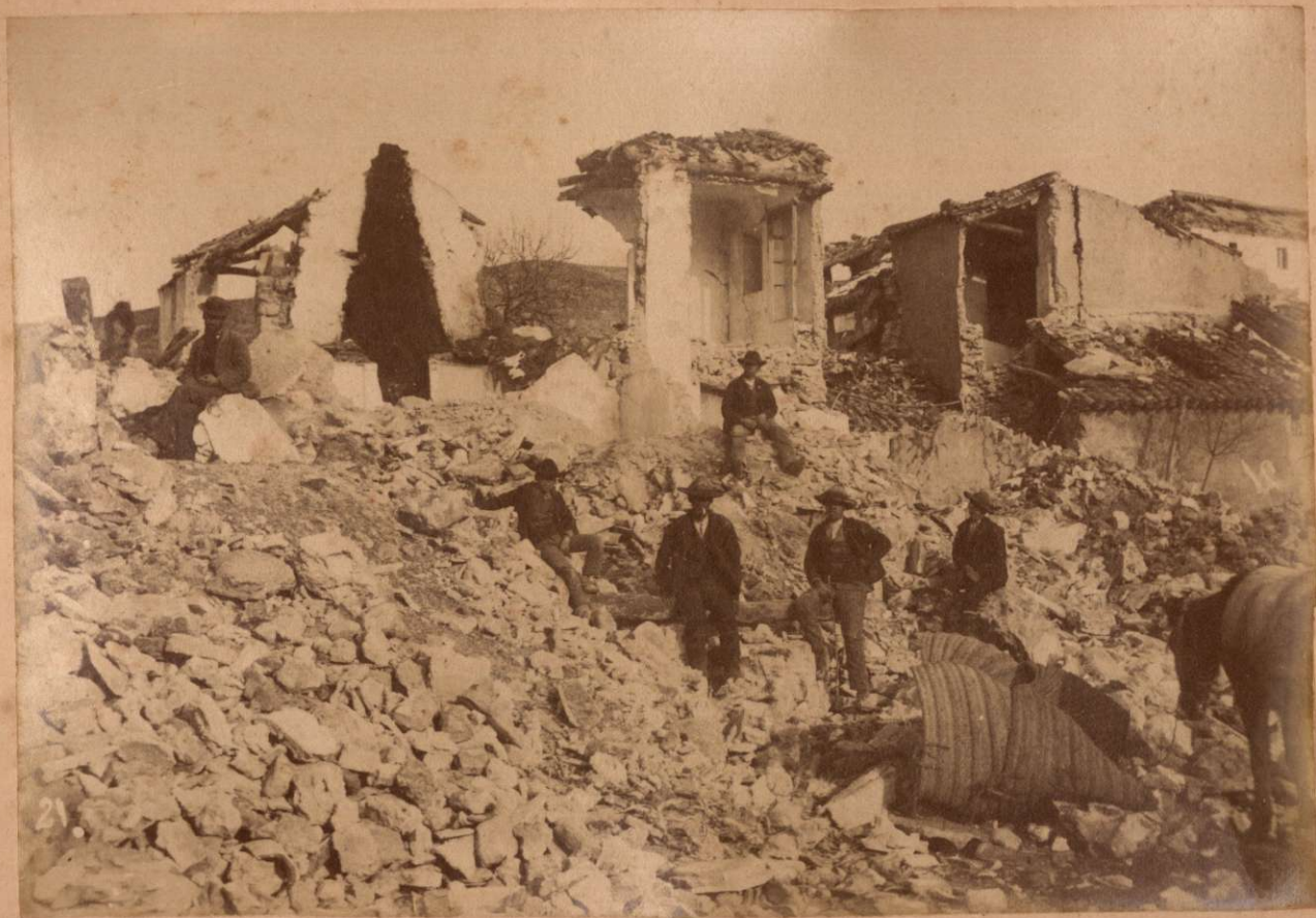
PLAZA DE ARENAS DEL REY.

Terremotos del Sud de España en 1884 y 1885.