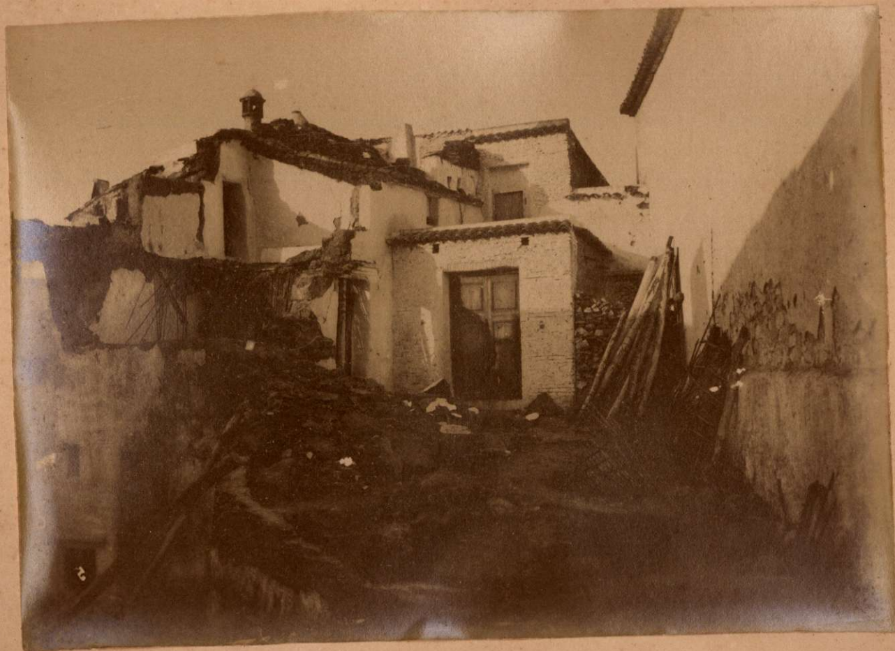
UNA CALLE DE CANILLAS DE ACEITUNO.

Terremotos del Sud de España en 1884 y 1885.