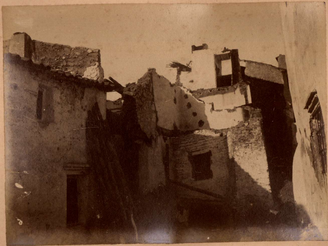
UNA CALLE DE ALCAUCIN.

Terremotos del Sud de España en 1884 y 1885.