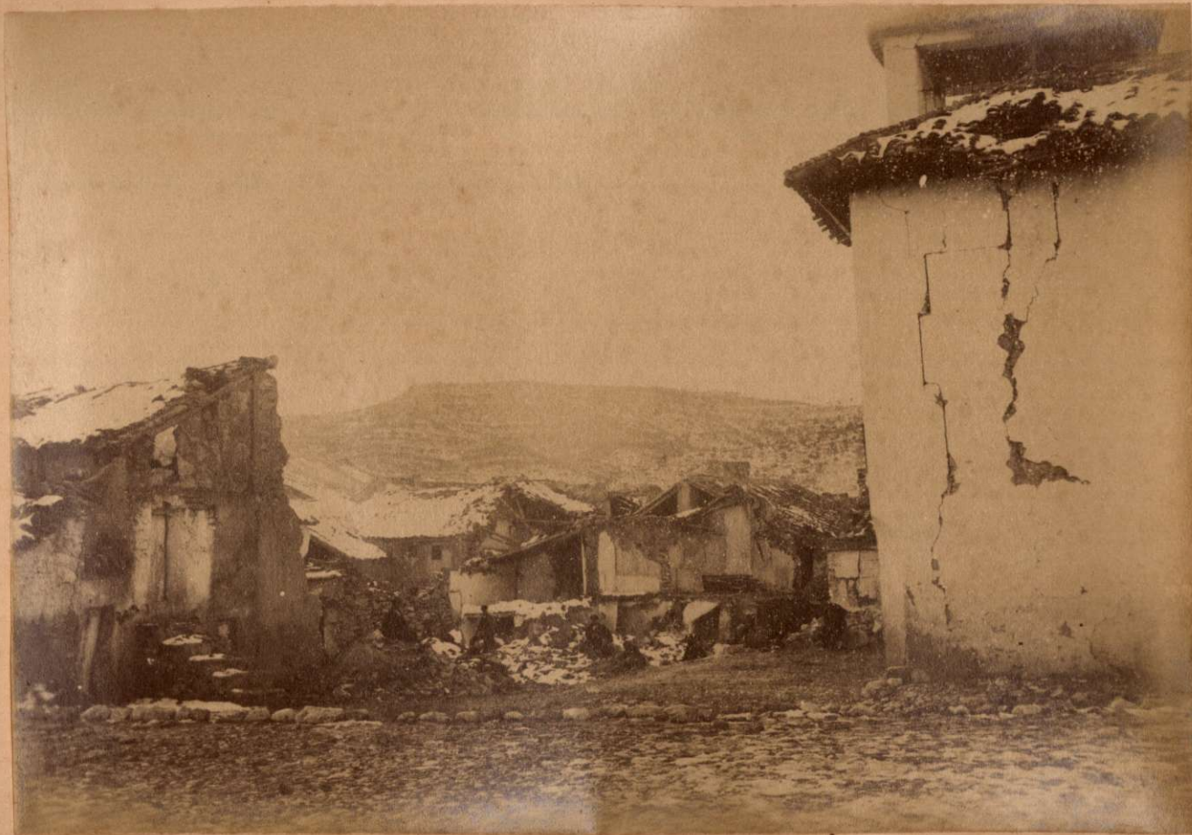
LA CALLE DE LA CONCEPCION EN JAYENA. Vista tomada desde el Campamento.

Terremotos del Sud de España en 1884 y 1885.