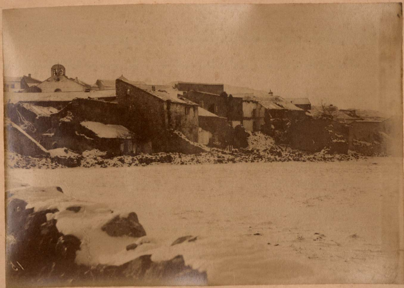
CHOZAS DEL REY. (ZAFARRAYA) DESDE EL CAMINO DE JATAR.

Terremotos del Sud de España en 1884 y 1885.