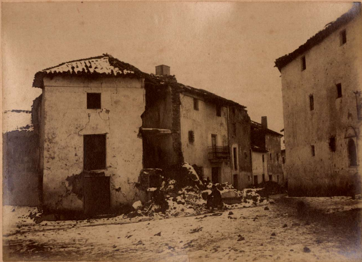
PLAZA DE JATAR.

Terremotos del Sud de España en 1884 y 1885.