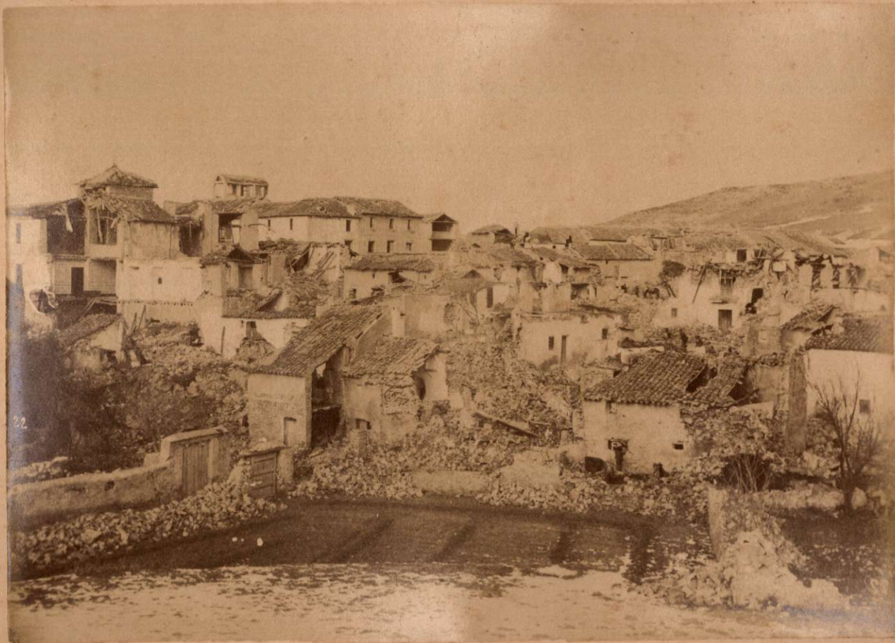
ARENAS DEL REY. Vista tomada desde la era en que está establecido el Campamento.

Terremotos del Sud de España en 1884 y 1883.