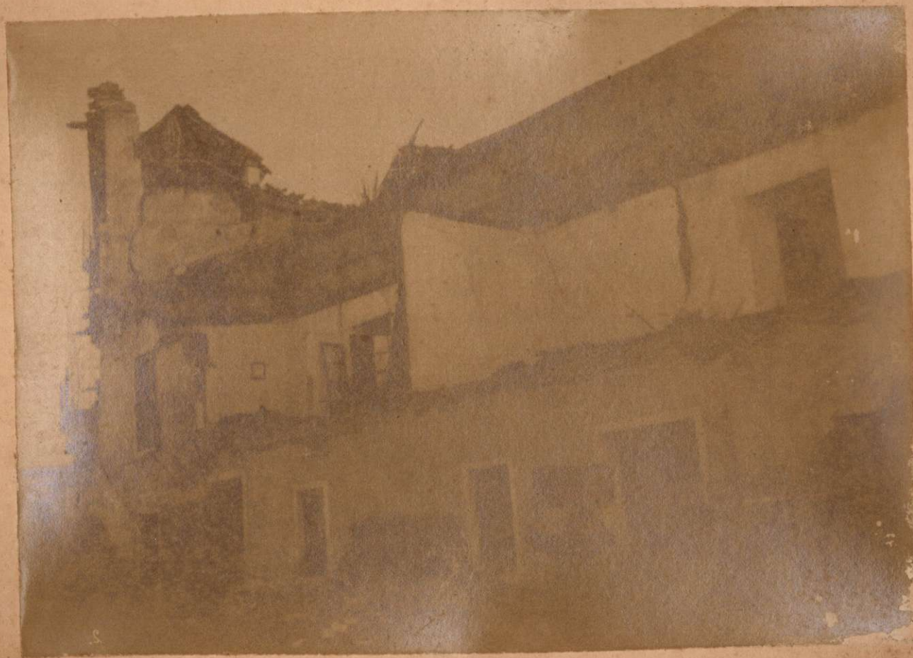
Calle del Paseo Viejo de VELEZ-MÁLAGA.

Terremotos del Sud de España en 1884 y 1885.