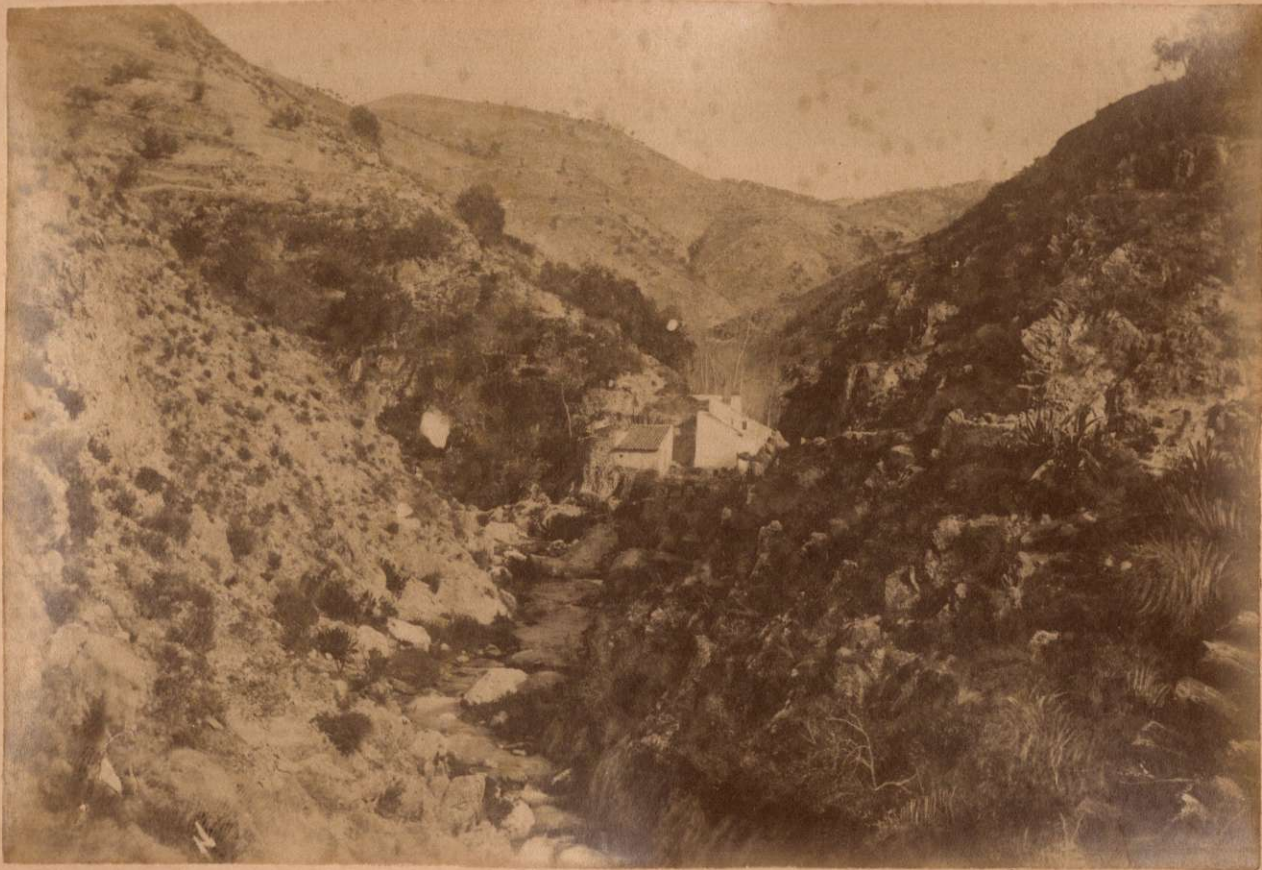
RIO DE CANILLAS DE ALBAIDA. Vista tomada desde el Puente.

Terremotos del Sud de España en 1884 y 1885.