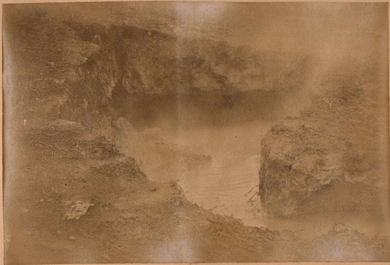
EL MANANTIAL NUEVO DE ALHAMA.

Terremotos del Sud de España en 1884 y 1885.