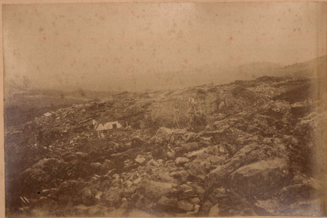
EL HUNDIDERO DE GUARO. Vista tomada desde el borde setentrional.

Terremotos del Sud de España, en 1884 y 1885.