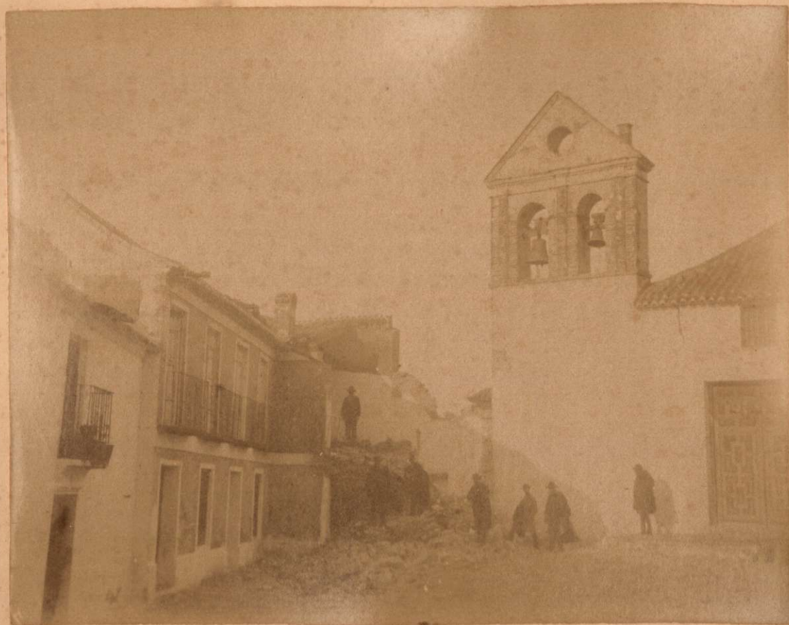
LA PLAZA DE ALCAUCIN IGLESIA Y CASA DEL AYUNTAMIENTO.

Terremotos del Sud de España en 1884 y 1885.