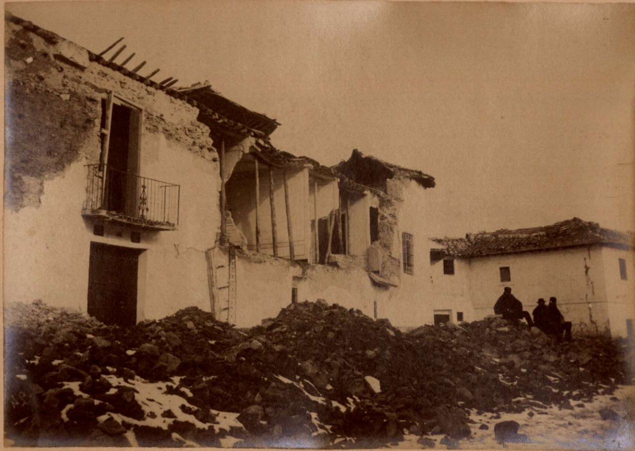
LA CASA GRANDE. PLAZA DE JAYENA. Vista tomada desde la esquina de la Iglesia.

Terremotos del Sud de España en 1884 y 1885.