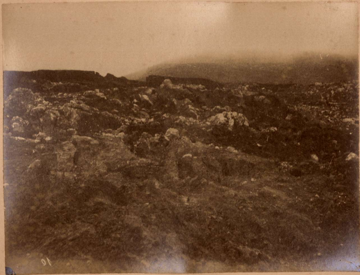
EL HUNDIDERO DE GUARO. Vista tomada desde el borde meridional.

Terremotos del Sud de España en 1884 y 1883.