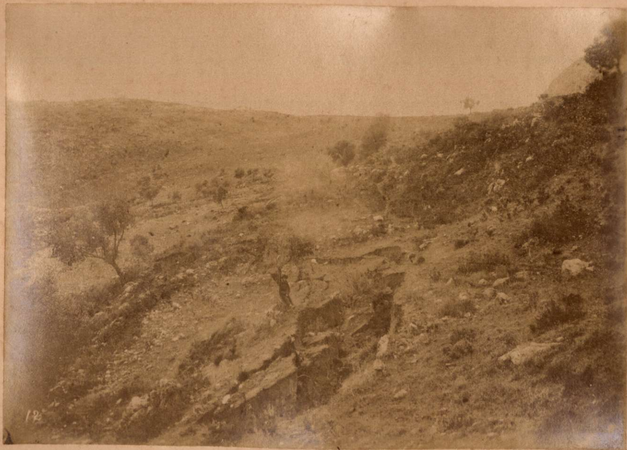
LA GRIETA DE EL BATAN. (Prolongacion del hundidero de Guaro.)

Terremotos del Sud de España en 1884 y 1885.