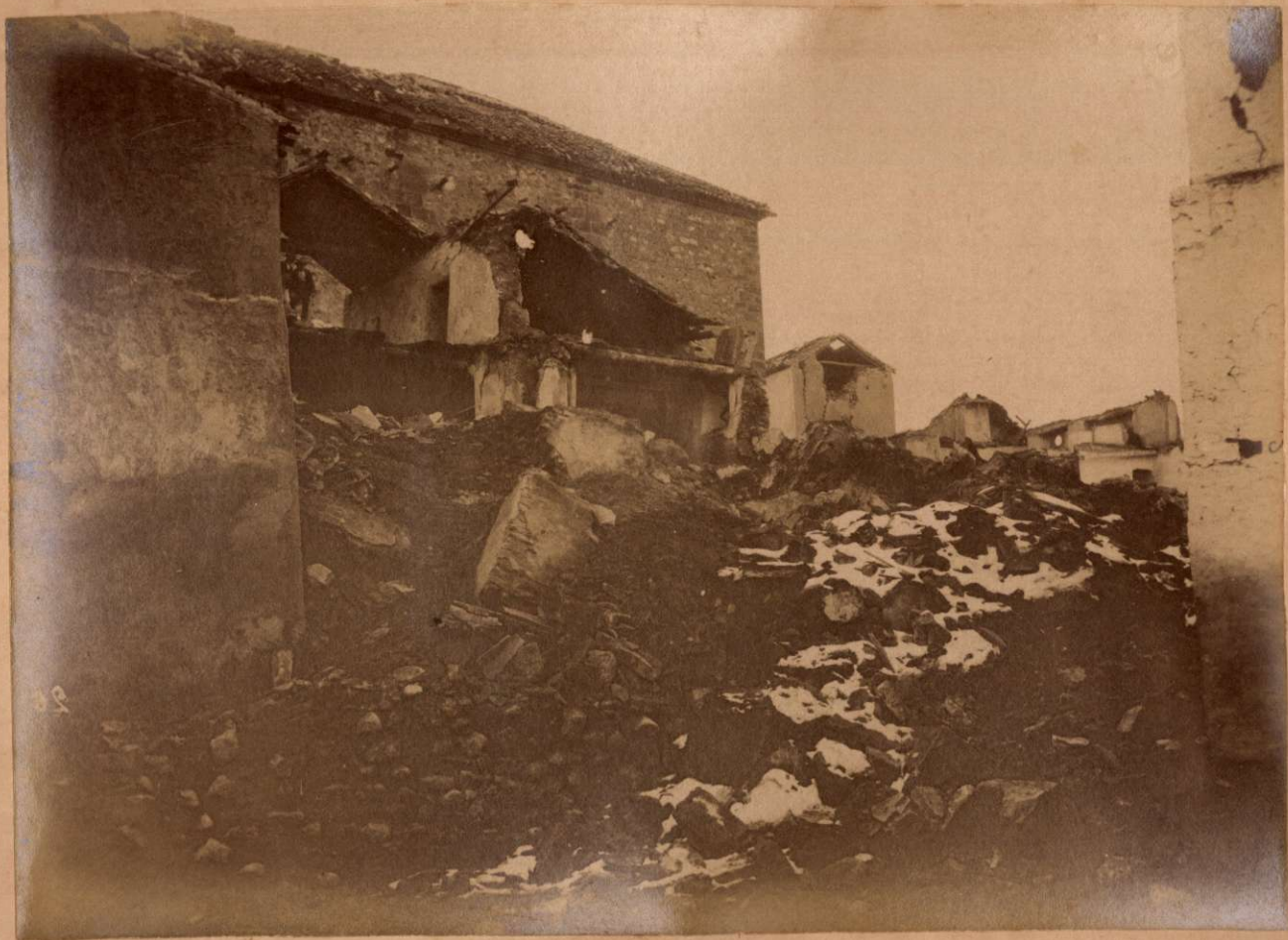
LA CALLE DE LA ACEQUIA EN JAYENA.

Terremotos del Sud de España en 1884 y 1885.