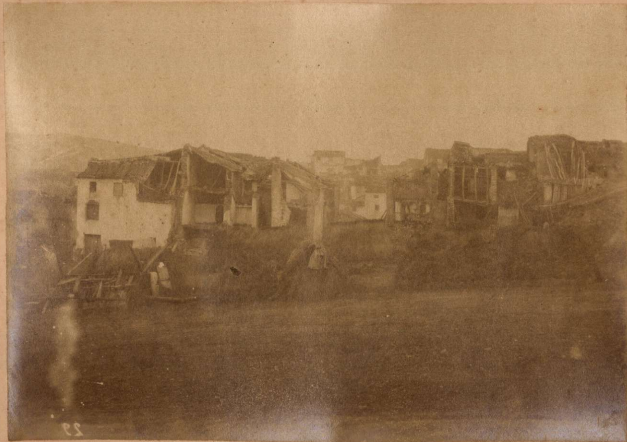
ALHAMA. Vista tomada desde un punto situado al Oeste del pueblo.

Terremotos del Sud de España en 1884 y 1885.