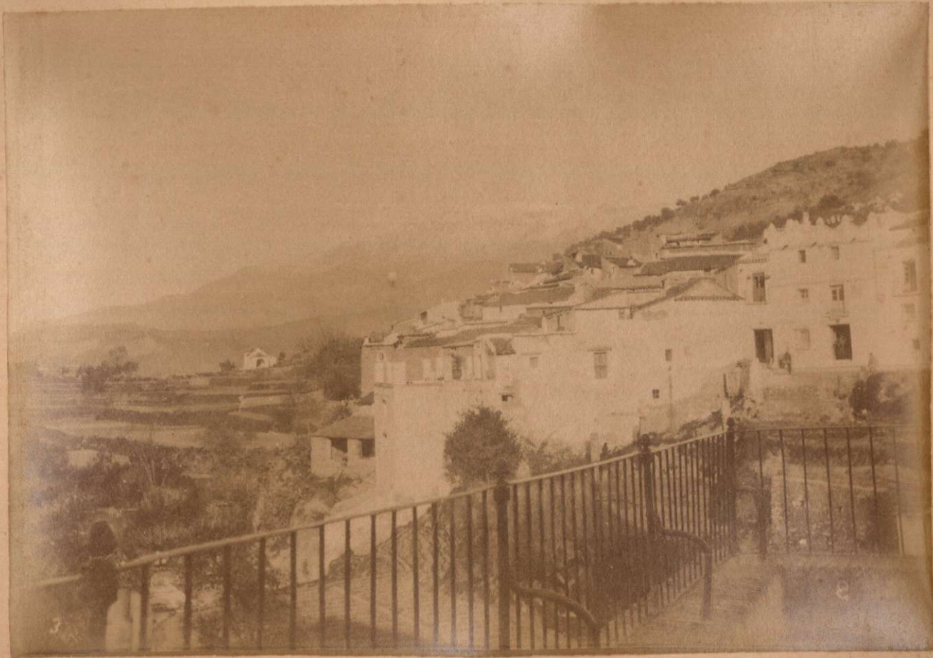
SIERRA TEJEDA. Vista desde la Iglesia de Cómpea.

Terremotos del Sud de España en 1884 y 1885.