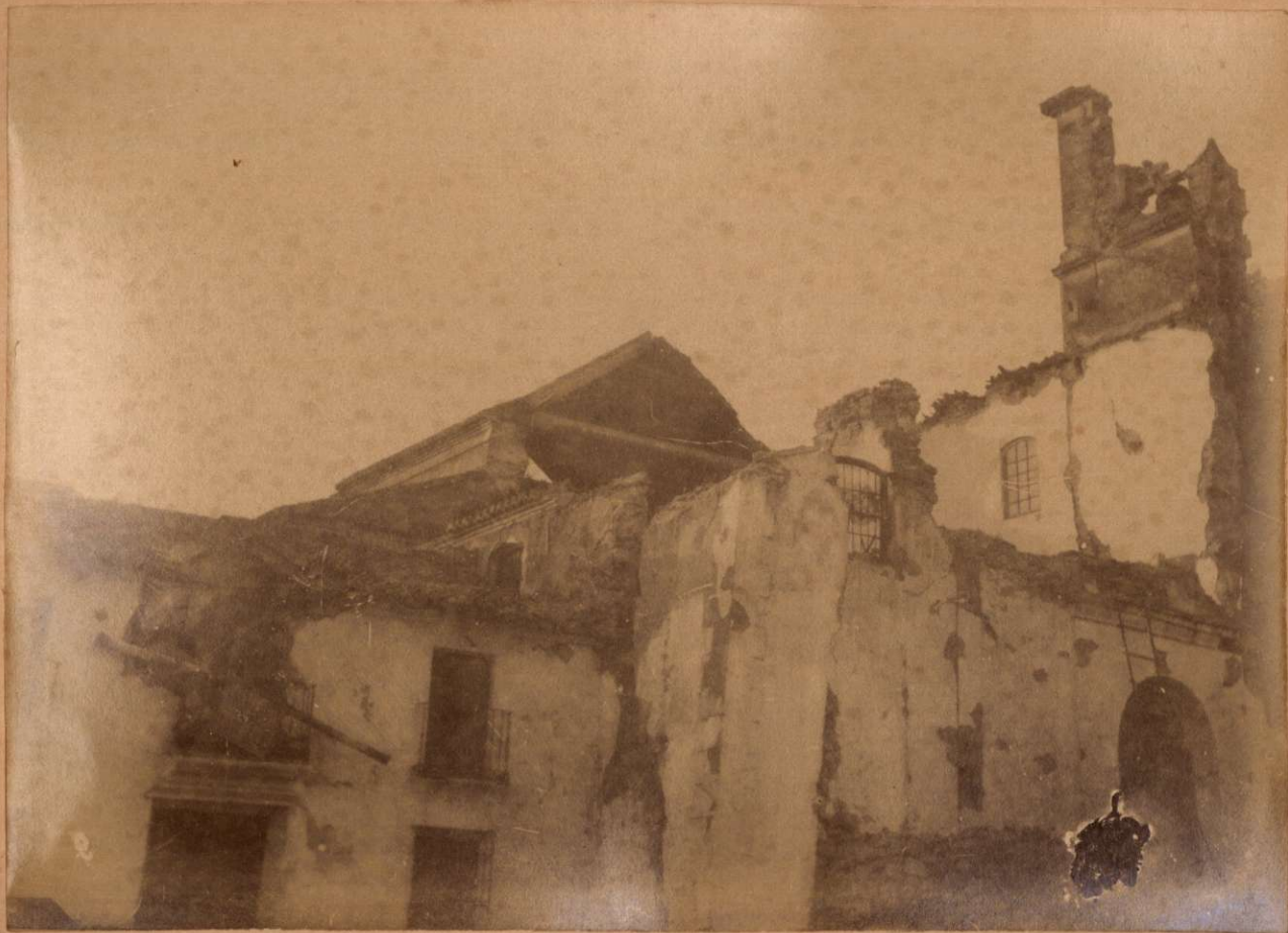
IGLESIA Y CUARTEL DE LA GUARDIA CIVIL EN PERIANA.

Terremotos del Sud de España en 1884 y 1883.