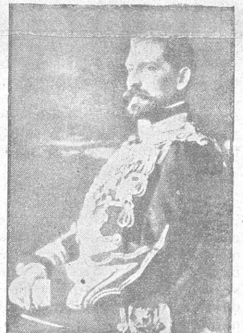
EL REY DE RUMANIA