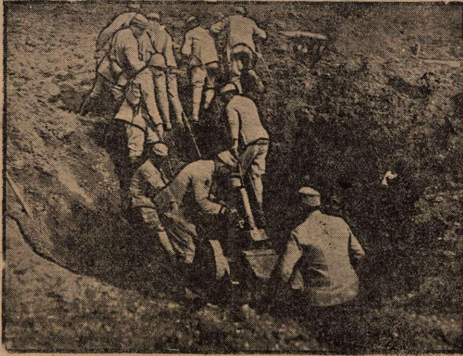
Cañón de trinchera en un agujero de obús

Fácilmente manejables y disimulables esas piezas de pequeño calibre, pueden transportarse hasta las primeras líneas, siendo enormemente destructores los efectos de sus rápidos disparos.