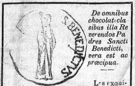
De omnibus chocolati classibus illa Reverendos Pades Benedicti vera est ac precipua.

Las legítimas cerillas inglesas de venta en el único depósito establecido en esta capital, expenduría de tabacos, calle de Mesones.—Cajas pajizas pequeñas, á 5 céntimos de peseta.—Llam azules, especiales, á 10 céntimos.—Varias clases y tamaños, según precio, hasta 3 pesetas 50 céntimos caja de medio quilo.—Grandes rebajas en pedidos al por mayor.