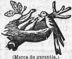
(Marca de garantía.)

Para evitar las numerosas falsificaciones, exigir en cada lata la firma del inventor: HENRI NESTLÉ.—VEVEY (SUIZA.)