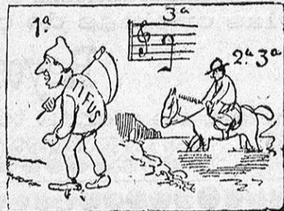
La solucion en el número próximo.

Solucion á la charada en accion: Mocetona.