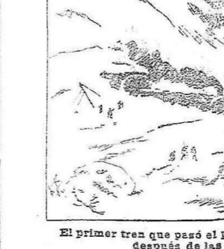
El primer tren que pasó el puerto de Pajares (Asturias), después de las últimas nevadas

traordinaria en los anales meteorológicos. Los puntos en que más espesor ha alcanzado la capa de nieve, son las sierras de Sorja y de Guadarrama y puerto de Pajares. Hay lugares en que aún la nieve alcanza una altura de cinco metros, estando en absoluto borrada toda huella de camino y hasta las líneas generales de muchos parajes, cuyas formas características han desaparecido bajo la nivea sábana.