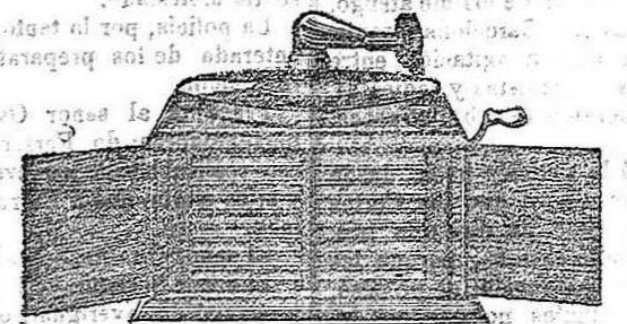
El Amphion abierto (cliché n.º 2)

con una maleta de pegamoid, con asa de cuero y conteras de metal, y así el aparato (cliché n.º 3) dentro su maleta es de tan fácil llevarlo como si fuera un saco de mano. Merced á este ingenioso llevarlo consigo para las vacaciones veraniegas sin sufrir molestia alguna de que no se le causa deterioro de ninguna clase.