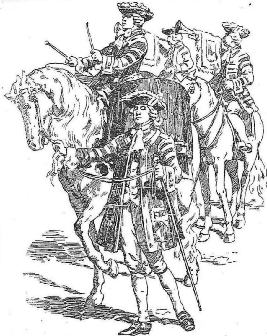
Timbaleros que hacen la publicación de las fiestas

toros, asaltando los tranvías y los coches que hacen el viaje por asientos, requiebrando á las hembras de trapío que pasan ó presencian el bullicioso desfile en los balcones. La plaza es, mientras dura la corrida, un hervidero de gritos, de palmadas y ovaciones delirantes como solo pueden verse en este circo taurino, donde un airoso movimiento de meteta tiene la virtud