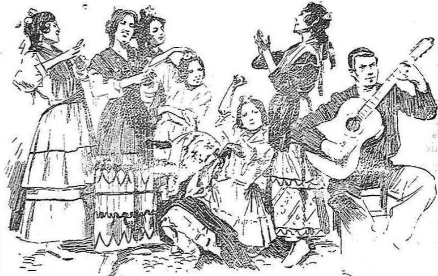
EN EL SACRO-MONTE.—Danza de gitanos

Al final de estas vistas se dará fue- go á cuatro cajas de cohetes volado- res, culebrinas y serpentinatas, que ilu- minarán el espacio fantásticamente, terminando con el trueno gordo.