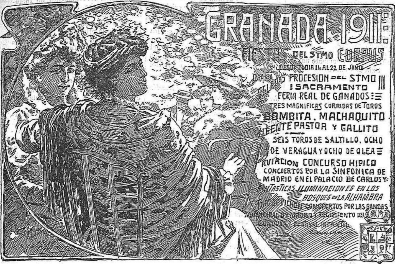
CATEL DE LAS FIESTAS DE 1911