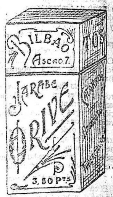
El Jarbe Orive es de gusto agradable y de acción sorprendente en todos los efectos del aparato respiratorio.