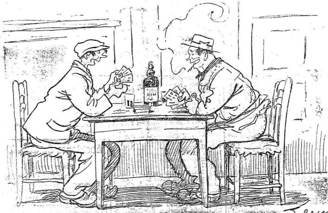
JUGADOR 1.º.—Ordago a la chica! EL DEFENSOR.—Ordago a la grande!