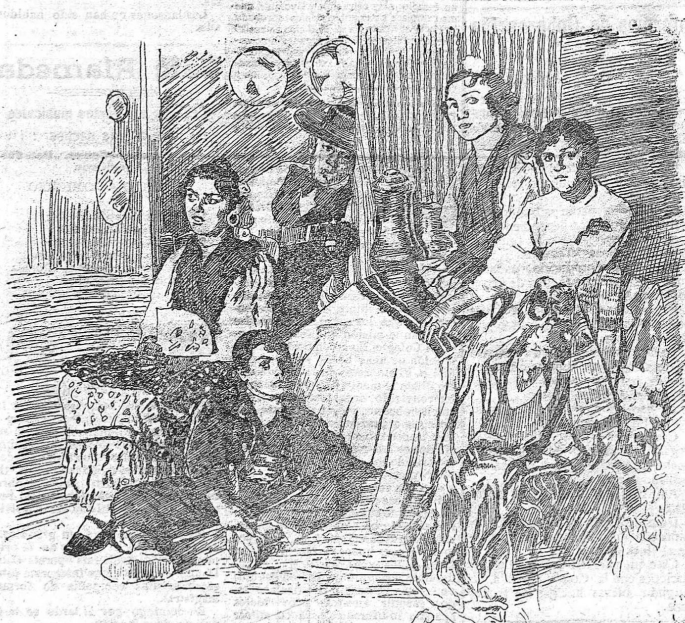
GITANOS DEL ALBAICIN (Cuadro de José Rodríguez-Acosta)