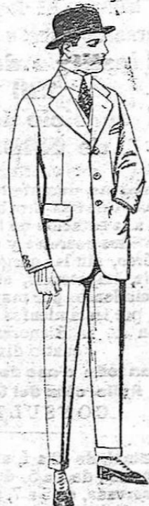
Trajos de cheviot, melton, vicuña, o jerga. De ptas. 47 a 190.

SUCURSALES.—Madrid, Barcelona, Alicante, Almería, Bilbao, Cádiz, Cartagena, Gijón, Granada, Málaga, Palma de Mallorca, Santander, Sevilla, Valencia, Valladolid, Zaragoza.