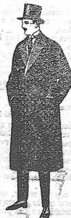
Gabanes de gamuza o vicuña, con vistas de seda. De ptas. 175 a 220.