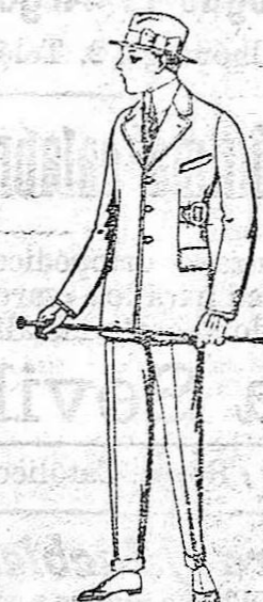
Trajos de patén, vicuña o jerga, etc., forma sport, para niños de 10 a 12 años. De ptas. 45 a 83. Los mismos para jovencitos de 13 a 16 años. De ptas. 48 a 85.