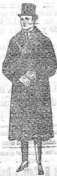
Gabanes de edredón negro, con cuello y vistas de piel. De ptas. 220 a 450.