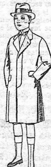
Gabanes de patén, para niños de 10 a 12 años. De ptas. 35 a 62.

Precio fijo. PIDASE EL CATALOGO GENERAL. Ventas al contado