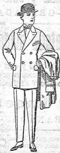
Trajos de patén, vicuña, etc., para niños de 10 a 12 años. De ptas. 39 a 85. Los mismos para jovencitos de 13 a 16 años. De ptas. 42 a 87