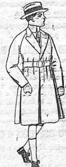
Gabanes de patén, para niños de 4 a 9 años. De ptas. 30 a 58.