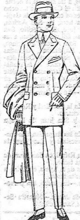
Trajos de cheviot, melton, vicuña o jerga. De ptas. 55 a 190.