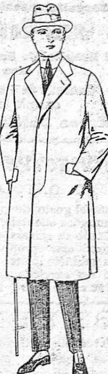
Gabanes de cheviot, gamuza patén, etc. De ptas. 55 a 70.