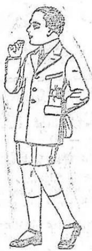
Trajes modelo sport, en pitén, para niños de 4 a 10 años. De ptas. 24 a 50