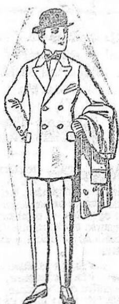
Trajes de patén, vicuña, jerga, etc., para niños de 10 a 16 años. De ptas. 40 a 90