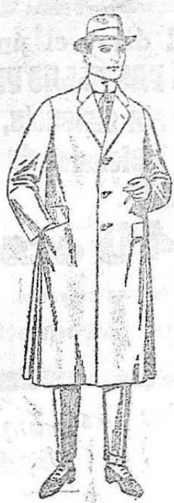
Gabanes de cheviot, mel-ton, gamuze, etc. De ptas. 43 a 150

SUCURSALES.--Madrid, Barcelona, Alicante, Almería, Bilbao, Cádiz, Gijón, Málaga, Palma de Mallorca, Santander, Sevilla, Cartagena, Valencia, Valladolid, Zaragoza.