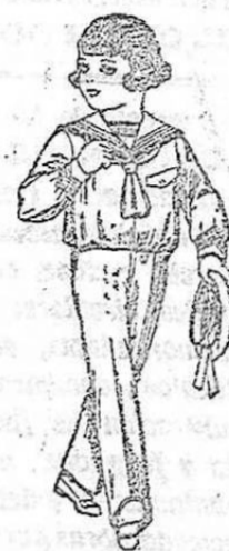
Traje maricero en vicuña o jerga azul, para niños de 3 a 9 años. De ptas. 19 a 63