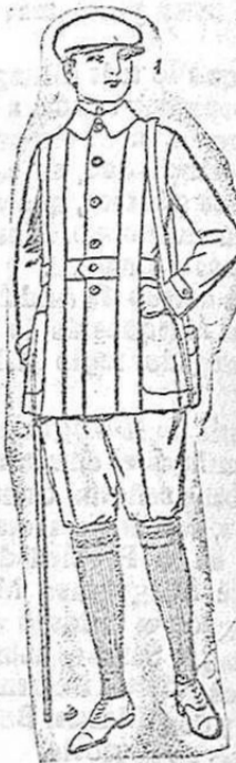
Cazadores de pana, para sport. A ptas. 42. Bieches pana. A ptas. 32

Ropas confeccionadas para caballero, señora, niño y niña.