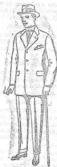
Trajes de cheviot, méton, vicuña o jerga. De ptas. 38 a 135