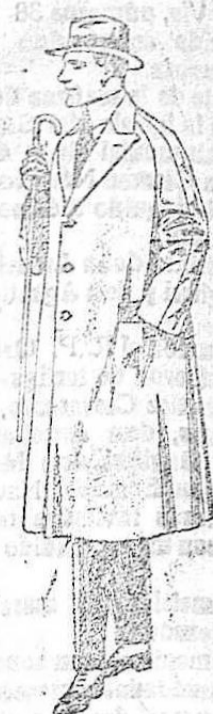
Sacos según de gabardina color. De ptas. 115 a 150