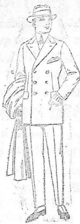
Trajes de cheviot, estambre, vicuña o jerga. De pas. 85 a 145