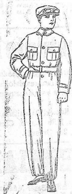
Trajes enteros de drill azul o kaki para marcial. A pts. 30