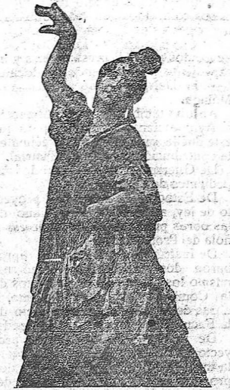
ELOISA CARBONELL, bella ballarina de aires andaluces, que forma parte de la troupe Gari-Huet, que actúa en el teatro Cervantes