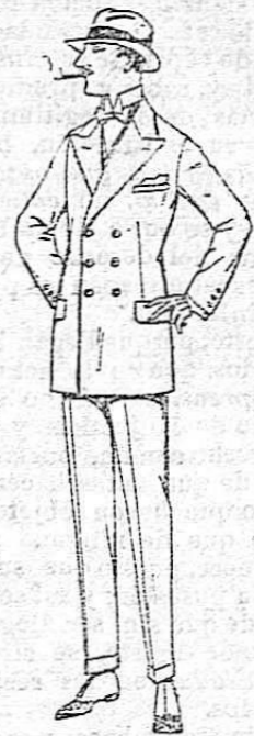
Trajes de lanilla, melton, estambre, vicuña, jerga, etc. De ptas 40 a 150