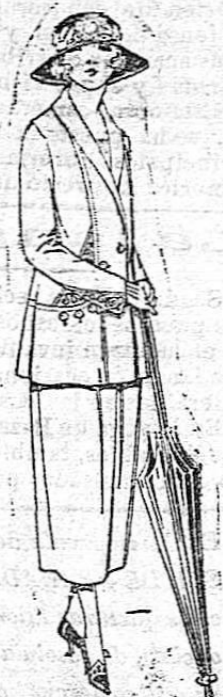
Trajes sastré, de sarga inglesa, popeline etc. adornos bordados, chaqueta forrada de seda, en marino, negro y colores moda. De ptas 125 a 160