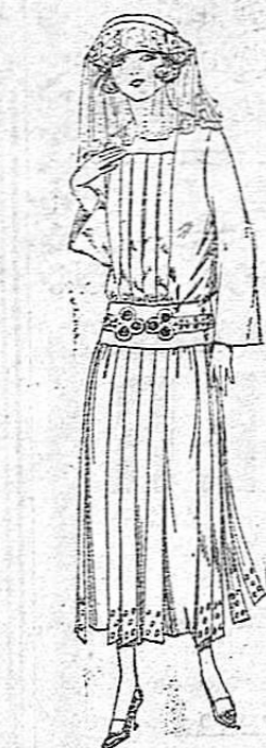
Vestidos de popeline, sergá etc., en negro, azul y color, adornos bordados. De ptas. 95 a 110