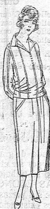
Blusas de voile de seda, listada, colores moda. De ptas. 23 a 27