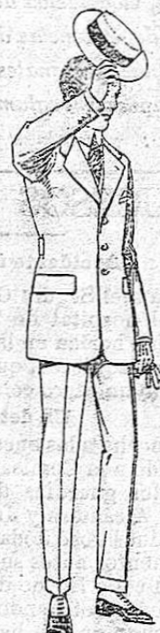
Trajes modelo Sport, de lanilla, melton, etc. De ptas. 52 a 175