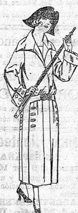
Abrigos de g-berdina inglesa, impermeabilizada, en negro, azul y color. De ptas. 85 a 200