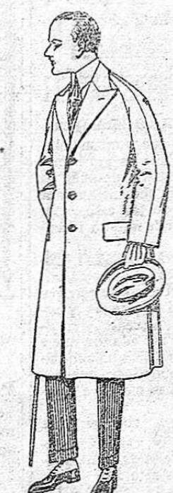
Gabanes de melton, gabarota, etc. De ptas. 60 a 180