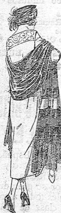
Echarpes de seda, diferentes dibujos y calidades. De ptas. 20 a 200