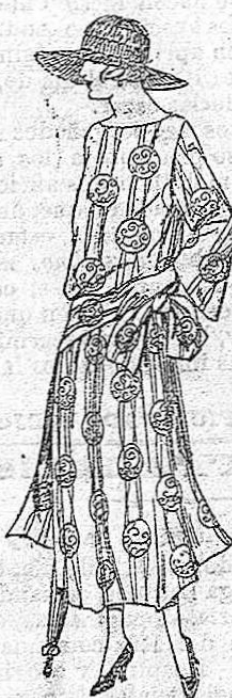
Vestidos de velo de algodón estampado, diferentes dibujos. De ptas 55 a 70