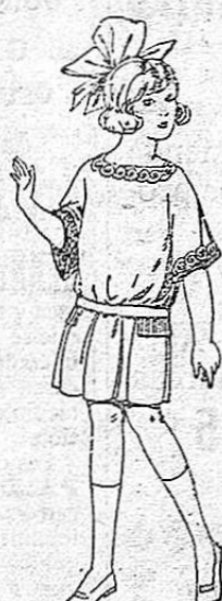
Delantales de voile, colores moda, adornos bordados, para niñas de 3 a 6 años. De ptas. 12 a 18