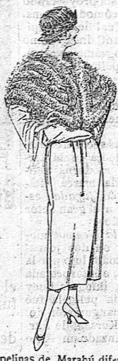
Capelinas de Marabú diferentes modelos, en negro, blanco y marrón. De ptas. 30 a 75