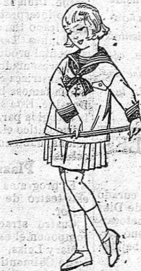
Trajes modelo «Marinera inglesa», de dril, otomán o satén blanco, para niñas de 4 a 9 años. De ptas. 20 a 35