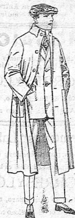
Guard-polvos de dril, igual al modelo. De ptas. 10 a 20

SUCURSALES.--Madrid, Barcelona, Alicante, Almería, Bilbao, Cartagena, Cádiz, Gijón, Málaga, Palma de Mallorca, Santander Sevilla, Valencia, Valladolid, Zaragoza.