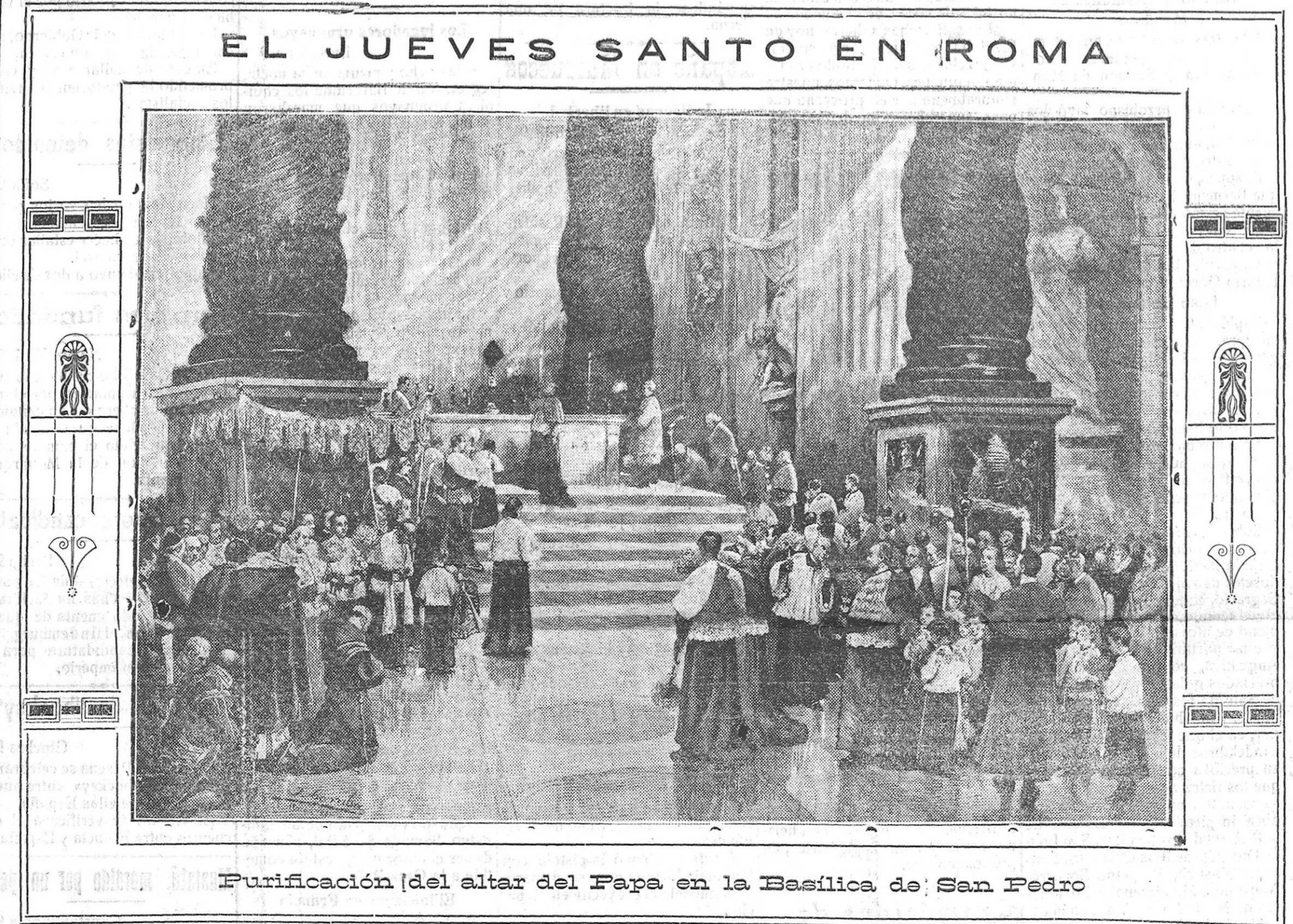
EL JUEVES SANTO EN ROMA