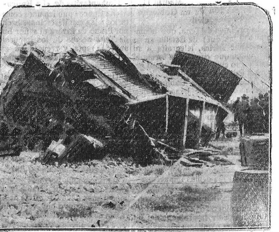
Furgón que recibió la embestida de la locomotora del rápido, y donde murió horriblemente aplastado el guardafrenos del mercancías.